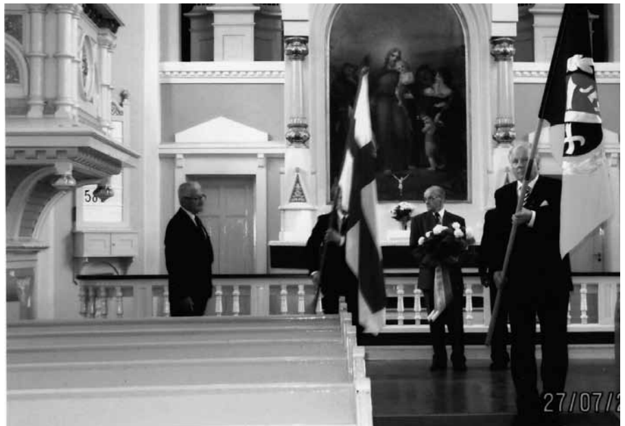
Seppelapartio lähdössä sankarihaudalle.

- Tahtoisin lisätä tähän myös, että on muodostunut tällainen perintöasia meille jäljellä oleville. Kun Adolf Ehrnrooth itse pääsi eläkkeelle aikanaan 60 ikävuoden jälkeen, hän ehti yli 30 vuotta tekemään maanpuolustustyötä matkaten käynneillään eri tahoille. Erikoisesti hän oli Etelä-Pohjanmaalla useilla käynneillä alkaen Vaasasta, Kyrönmaalle, Kurikkaan, Kauhajoelle, Ilmajoelle ja Seinäjoelle. Hän oli monessa juhlatilaisuudessa läsnä, arvokkaan sanan käyttäjänä ja rohkaisevana puheenpitäjänä. Näin ollen on ymmärrettävää, että hänen jälkeensä jättämä velvoite on suuri meille jäljelle jääneille perintöasiana. Meillä perintöyhdystys kulkee JR 7 perinnetoimikuntana, jossa minä mukaan luettuna eräiden aseveljien kanssa olemme runkona, jota on täydennetty nuoremman polven jäsenillä. Meitä on noin 10 miehen joukko, joka näitä asioita pohtii ja katsoo, miten hoidetaan oman jäljellä olevan aikamme nojalla.