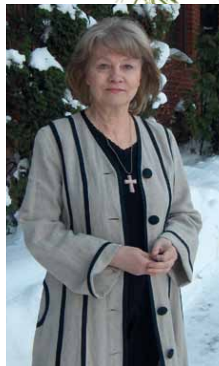
Toivotan jokaiselle lukijalle siunattua ja rauhallista joulun aikaa

On taas aika ajatella ja muistaa kiihtöllisyydellä, miten onnellisia olemme saadessamme vapaasti viettää joulua, Jeesuksen syntymäjuhlaa, vapaassa maassa.